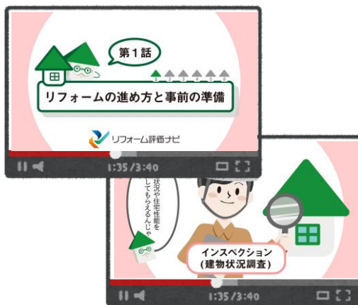
マンガ動画（イメージ）