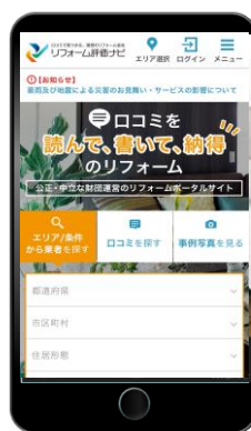
<TOPページ> (スマホサイト)