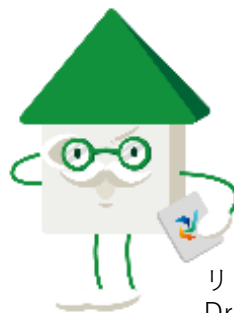
リフォームナビゲーター Dr.カイゾウ

リフォームが大好きで、リフォームのことなら何でも知っています。屋根の部分は開閉可能で、色々なものを保管しているウワサも・・・