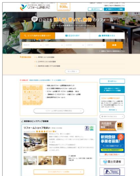
<TOPページ> (パソコンサイト)

さらに、 リフォーム依頼者が、工事終了後に口コミ評価を直接財団に投稿できるという仕組みを設けているので、依頼者の「リフォームで満足を得たいという願い」と事業者の「顧客満足と高評価を得たいという想い」が重なり、納得のいくリフォームが生まれます。