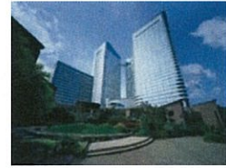
晴海トリトンスクエア