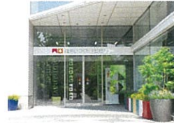
住まいづくりナビセンター