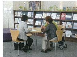
リフォーム相談光景